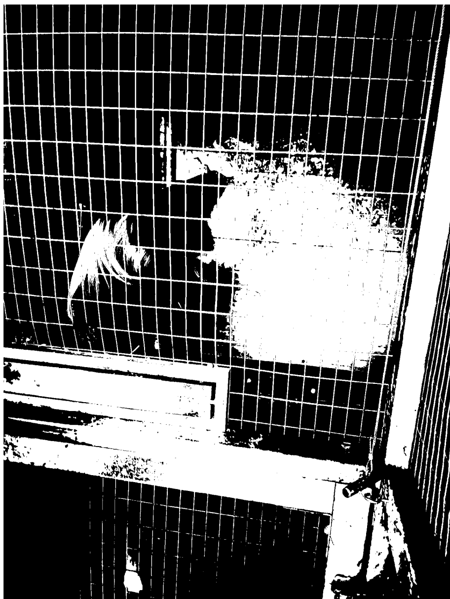
č. 15 – guerézy