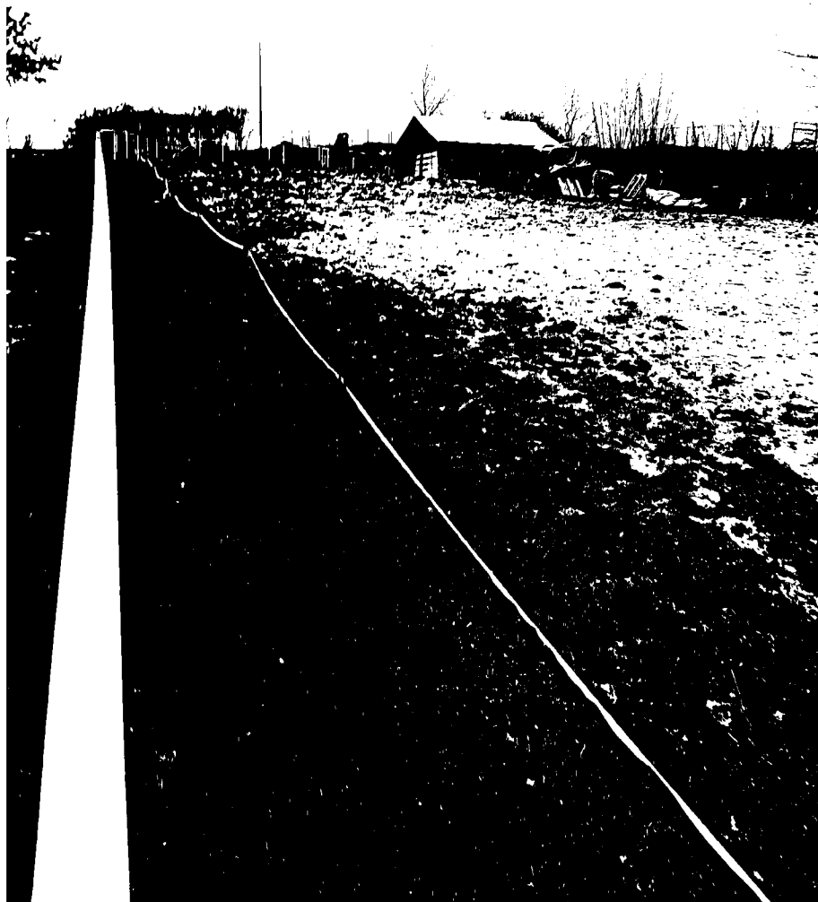
č. 16 – spodní výběh – velbloudi