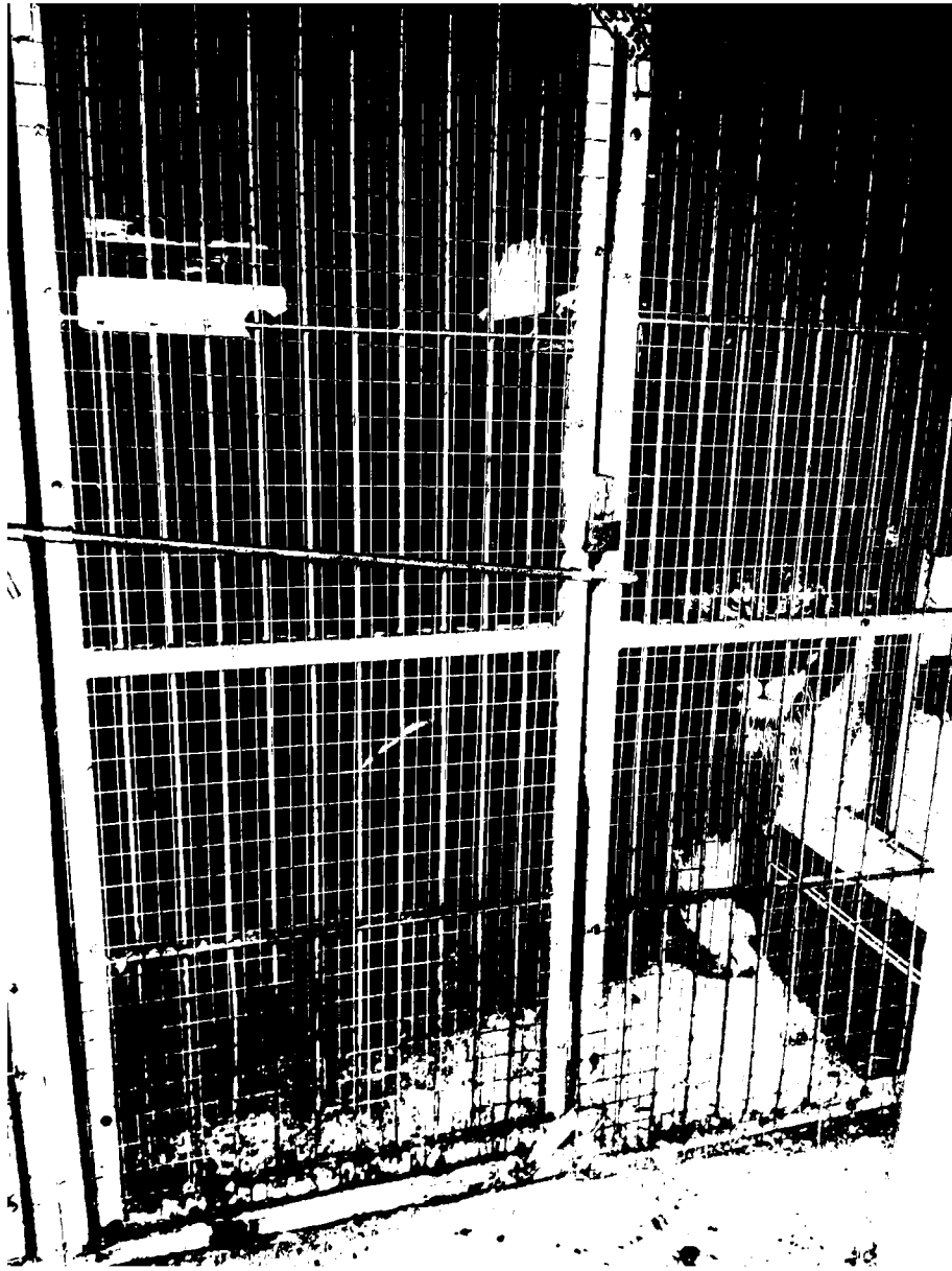
č. 13 – lvi