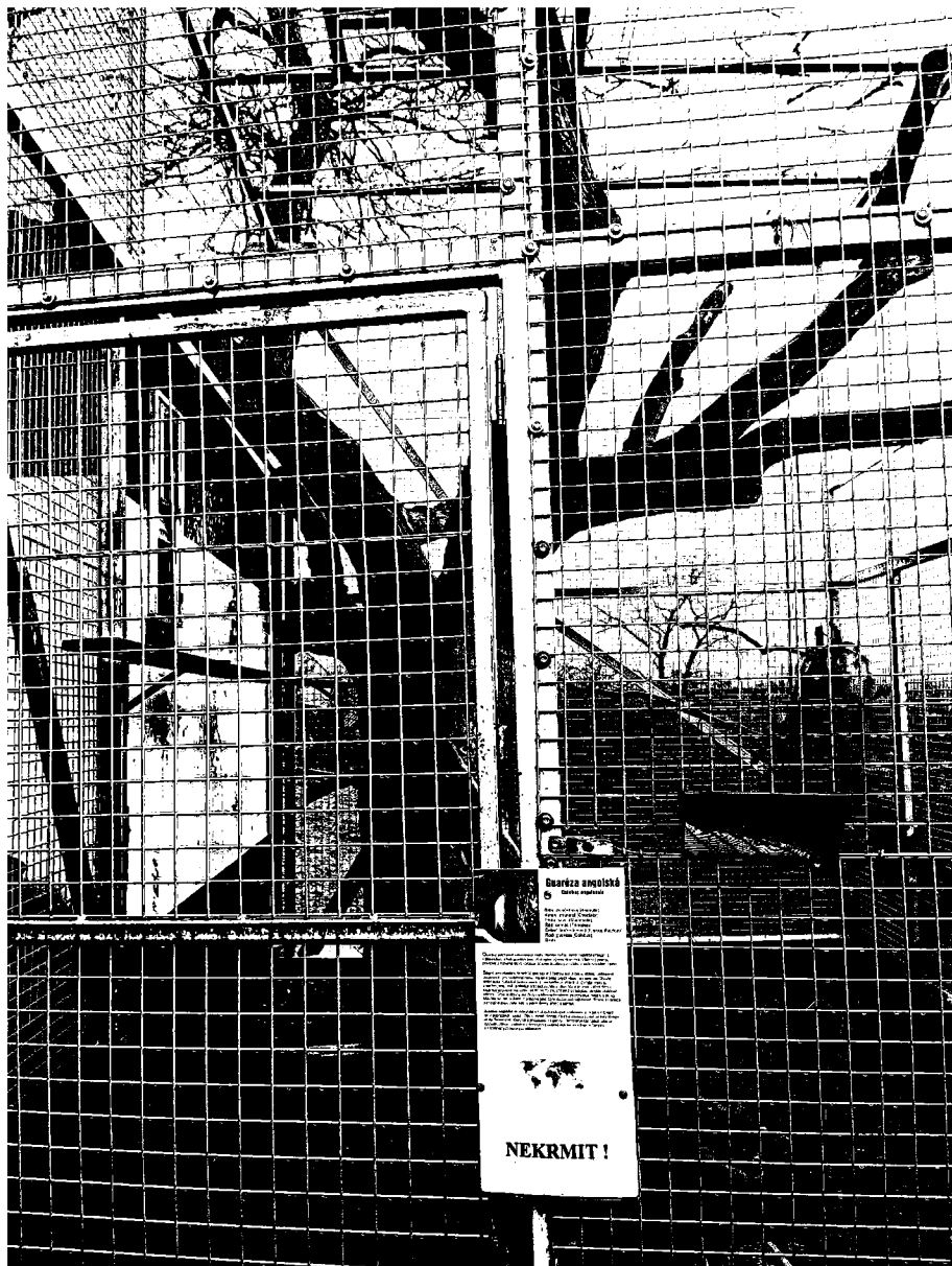
č. 14 – výběh – guerézy