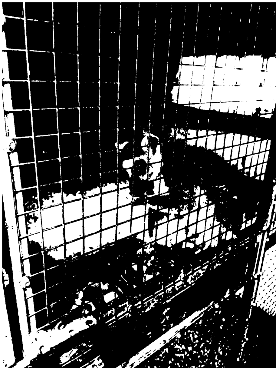
č. 10 – lemuři