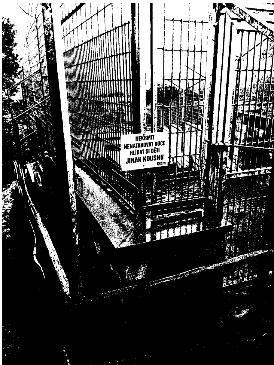
č. 12 – výběh – lvi