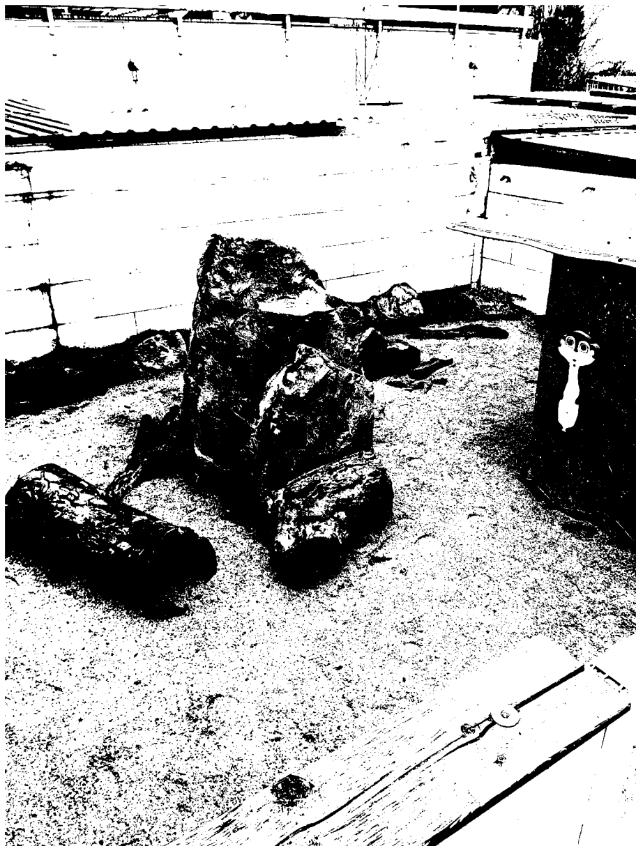
č. 3 – výběh – surikaty