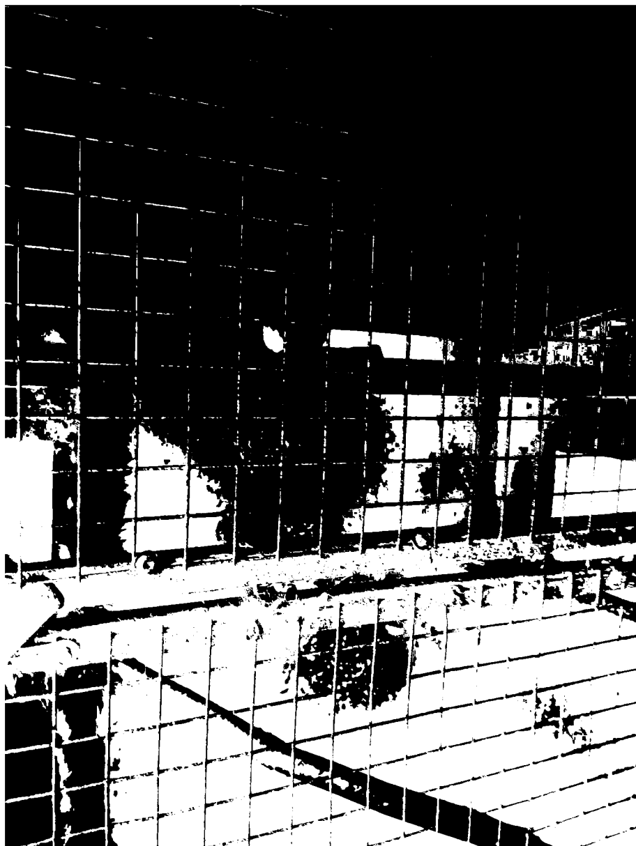
č. 11 – lemuři