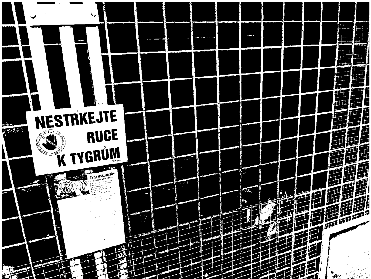
č. 5 – výběh – tygři