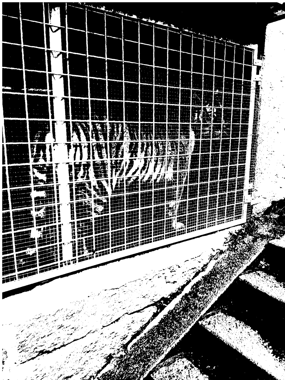
č. 7 – výběh – tygři