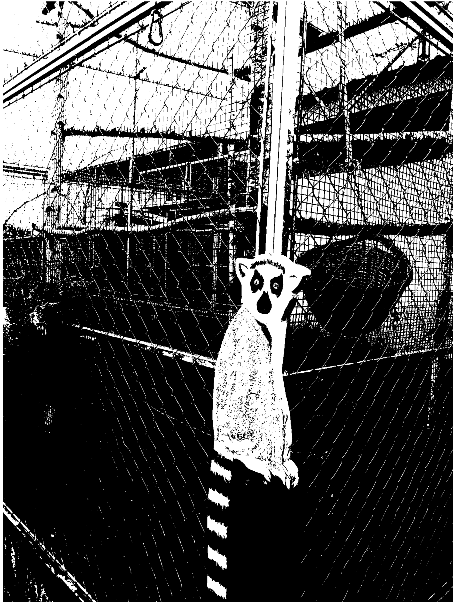
č. 8 – výběh – lemuři