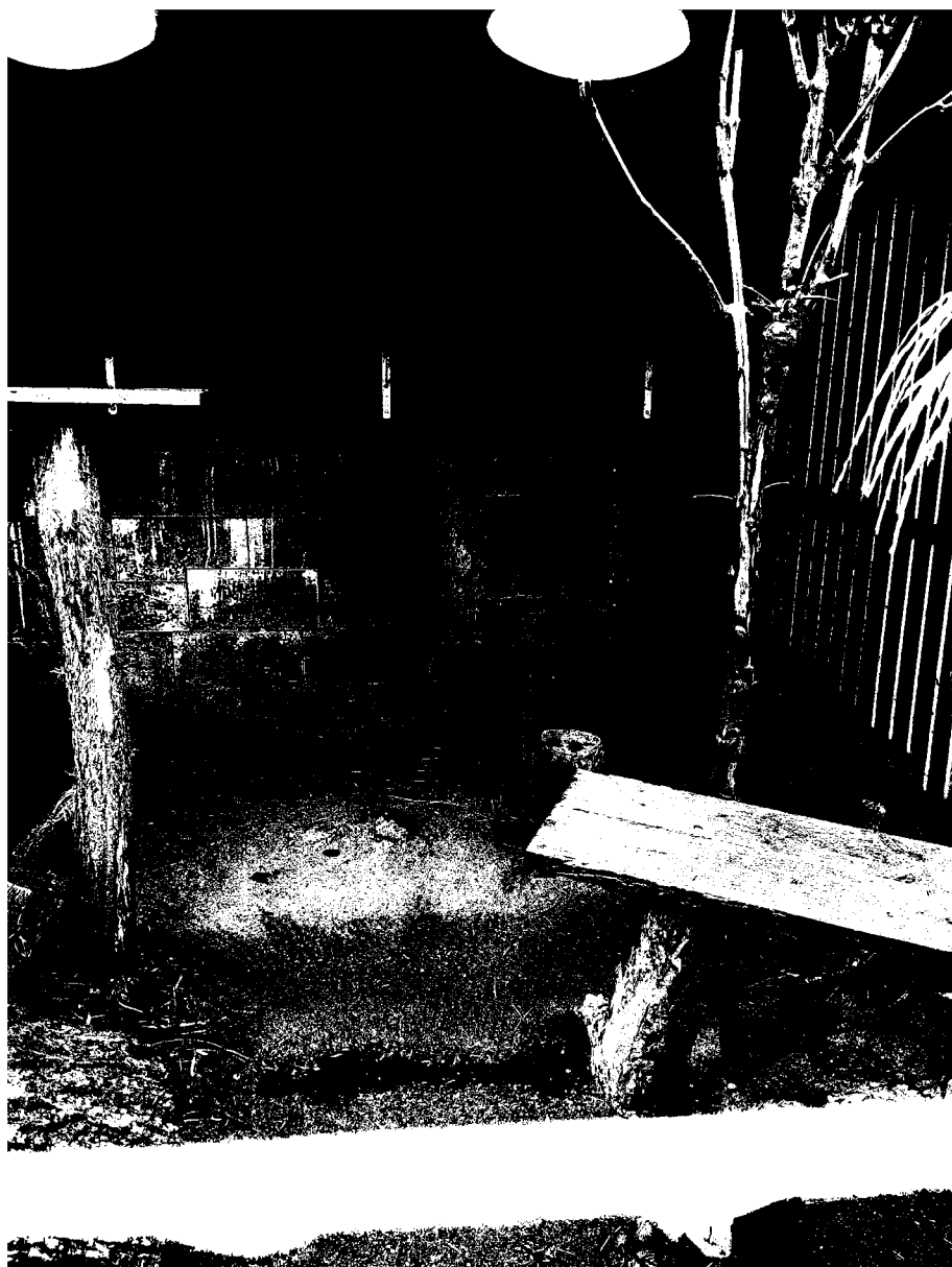
č. 2 – rys červený