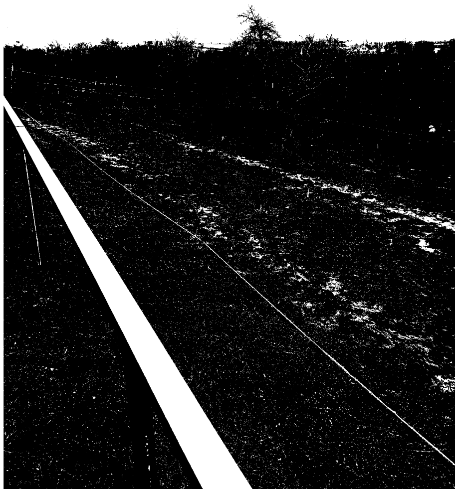
č. 17 – horní výběhy – velbloudi