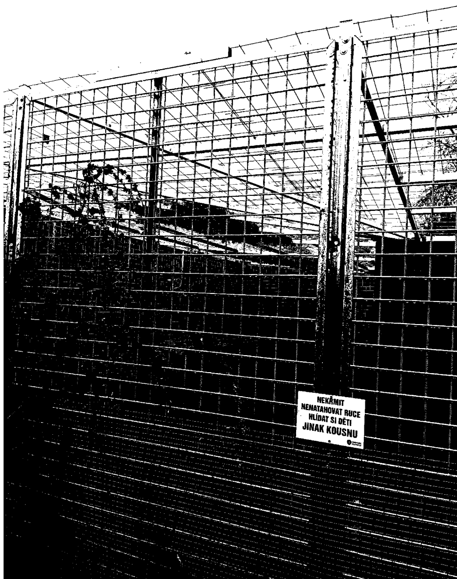
č. 6 – výběh – tygři