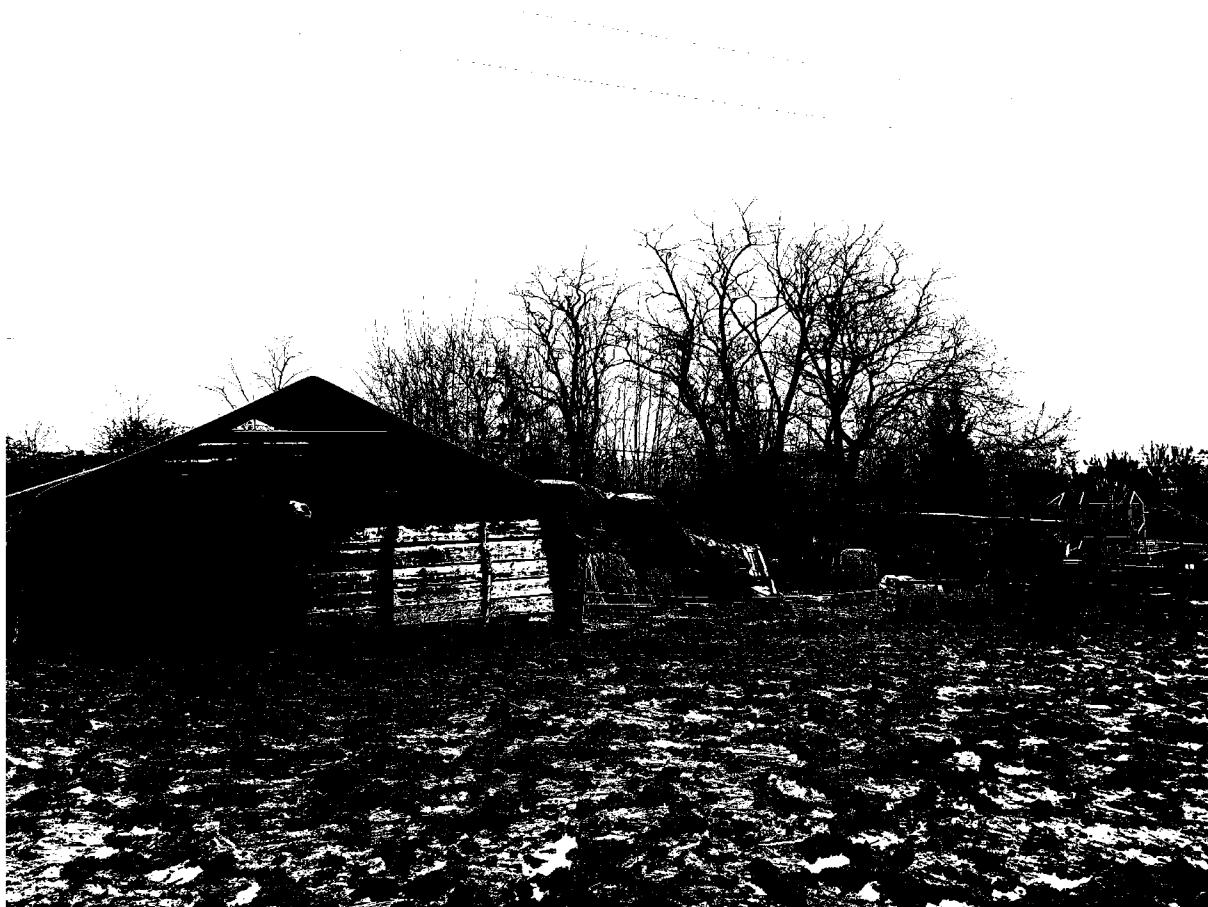
č. 18 – velbloudi, nový přístřešek